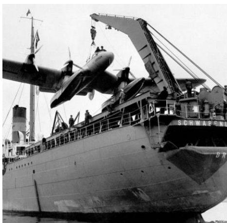
Рис. 3. Погрузка гидросамолета на немецкое исследовательское судно «Швабиенланд».

Интересны сведения о том, что в Антарктиде немцы использовали засекреченный СС авианосец «Манфред фон Рихтгофен». Известно, что этот авианосец отправлялся только в Антарктиду. Дальнейшая его история неизвестна. Возможно, потому что он там затонул или его затопили, чтобы существование мощного авианосца у Третьего Рейха навсегда осталось тайной. В дальнейшем этот затонувший авианосец был якобы обнаружен на дне у берегов Антарктиды в 1973 году экспедицией Жак-Ив Кусто на исследовательском судне «Калипсо», но затем снова исчез.