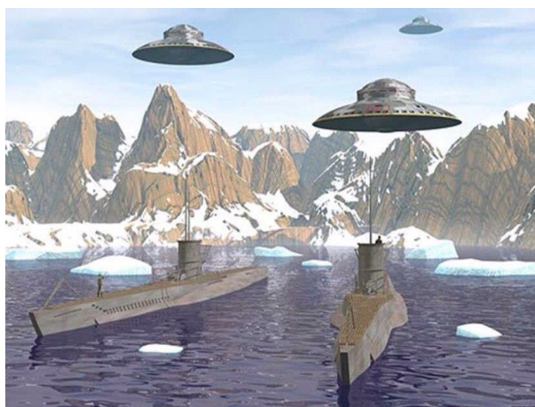
Рис. 4. Так, на взгляд художника, могла выглядеть база нацистов в Антарктиде

В ходе Нюрнбергского процесса появились показания свидетелей о том, что нацисты были уверены в том, что Земля королевы Мод – это часть бывшей Атлантиды. По наиболее распространенной версии нацистские исследователи обнаружили на Земле королевы Мод загадочные оазисы, а также огромную систему соединенных между собой пещер с теплым воздухом. Считается, что одним из направлений нацистских исследователей на секретной базе в Антарктиде (рис. 4) являлась разработка и испытание дискообразных летательных аппаратов («летающих тарелок»), основанных на принципиально новых технологиях древних атлантов. По мнению автора, речь идет о дирижаблях в форме «летающих тарелок», снабженных легкими реактивными двигателями.