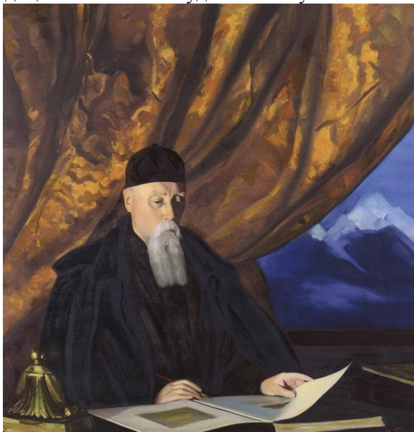
Рис. 1. Руководитель Центрально-Азиатской экспедиции Николай Рерих

По имеющейся на сегодняшний день информации, начало погони за древними технологиями, которые предположительно можно было обнаружить в Антарктиде, следует отнести к Центрально-Азиатской экспедиции, которая комплексно проводилась с 1923 года по 1928 год. Руководил экспедицией известный художник и путешественник Николай Рерих (рис. 1).