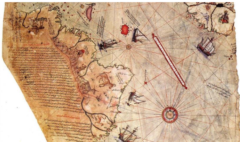
Рис. 7. Антарктида на карте Пири-рейса

Объективно вырисовывается следующая картина. На древней карте Пири-рейса (рис. 7) показана часть Антарктиды свободная ото льда.