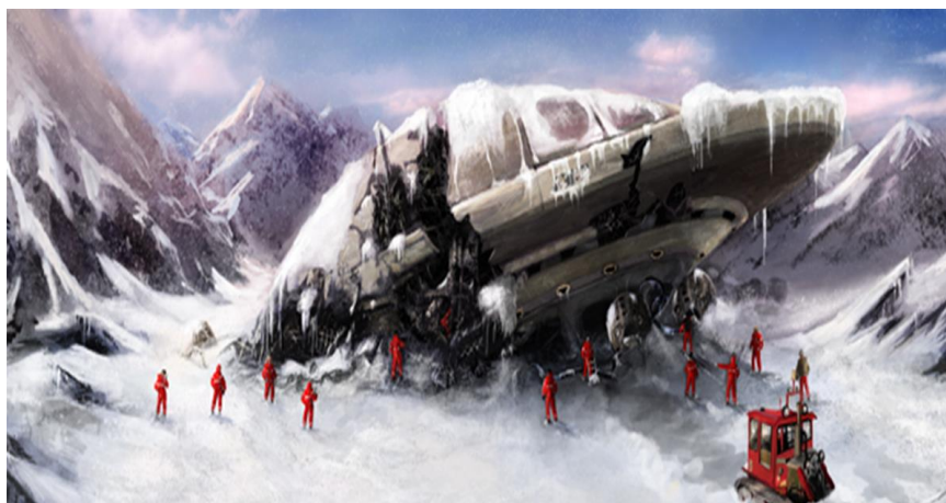
Рис. 8. Так, на взгляд художника, выглядят замороженные технические объекты (дирижабли в форме «летающей тарелки») в Антарктиде

Германию, США и Францию древние технические артефакты должны были очень интересовать. Поэтому и происходили загадочные события, описанные выше. Все засекречивалось, для населения стран придумывались всякие мифы. А была просто погоня за древними утраченными технологиями погибшей Атлантиды. Принцип прост – кто владеет передовыми технологиями, тот владеет миром! Не случайно последнюю сотню лет США и Германия (вспомним, что экономика Германии после войны была полностью уничтожена) являются одними из наиболее технологически развитых стран мира.