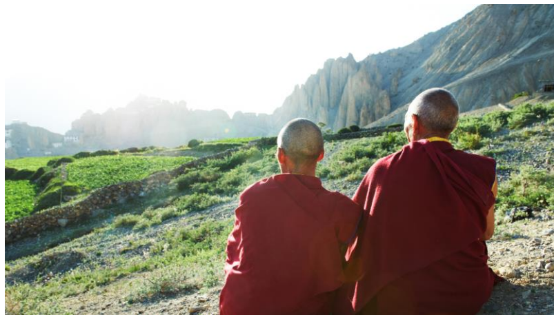
Рис. 2. Тибет и тибетские ламы – хранители тайн древности

Как считают историки, цели экспедиции были многоплановые – научные, художественные и ...выполнение специальных заданий ОГПУ. В этой экспедиции принимал участие (от ОГПУ) Яков Блюмкин. Каким-то образом ему удалось получить от тибетских лам (рис. 2) очень важную и интересную информацию. В 1929 году Яков Блюмкин был арестован и на допросе рассказал следователю о нескольких легендах лам Тибета.