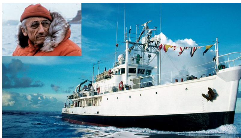
Рис. 6. Жак-Ив Кусто и исследовательское судно «Калипсо»

Но приключения в Антарктиде на этом не закончились. Осенью 1972 года французское исследовательское судно "Калипсо" (рис. 6) под руководством знаменитого исследователя Жак-Ив Кусто отправилось к Антарктиде. Официально Кусто должен был исследовать жизнь животных и снимать фильм. Но пока экипаж вёл судно через Атлантику, Кусто вылетел в Нью-Йорк, где ознакомился с американскими архивами, встретился с рядом политиков и подписал договор о сотрудничестве с NASA, которое обеспечило судно вертолетом.